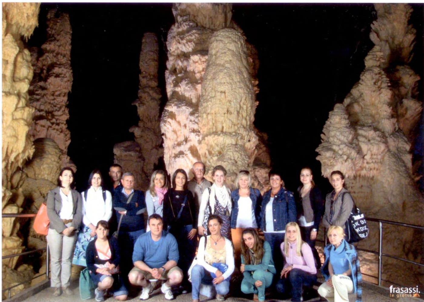
A frasassi cseppkőbarlangban