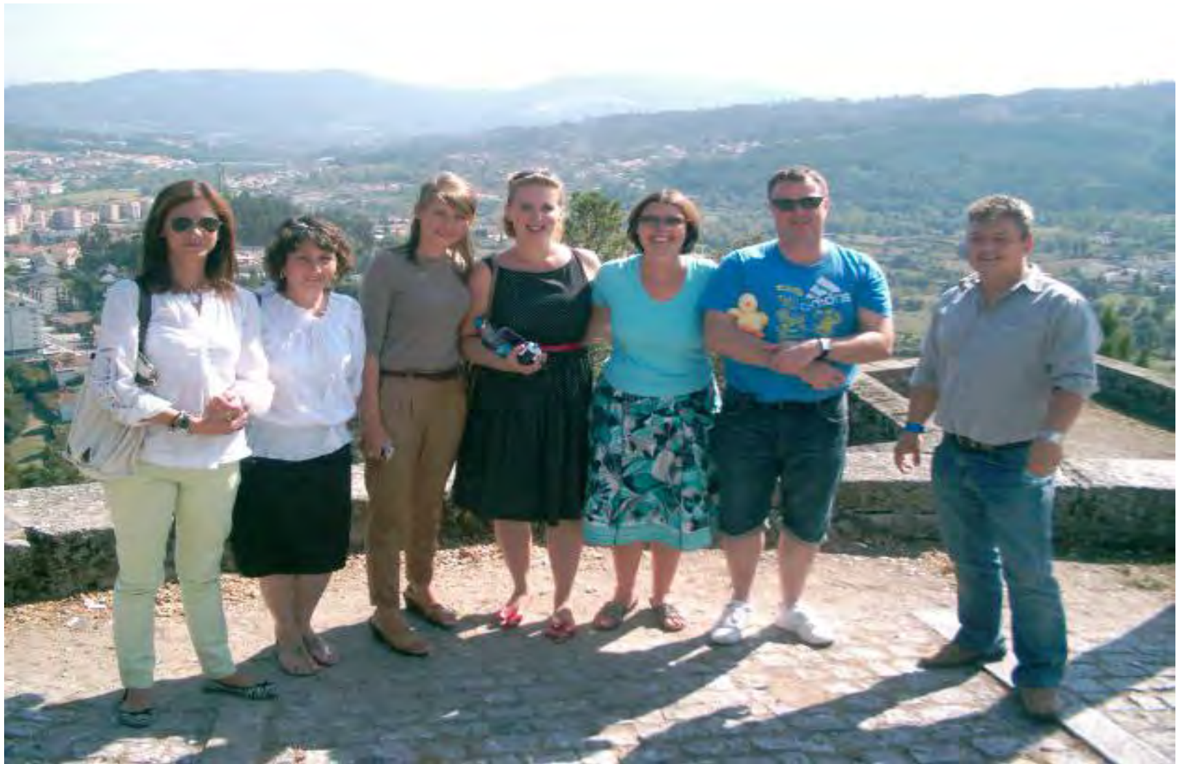
Szeptember 26, hétfő Meglátogattunk egy kastélyt és egy helyi templomot.