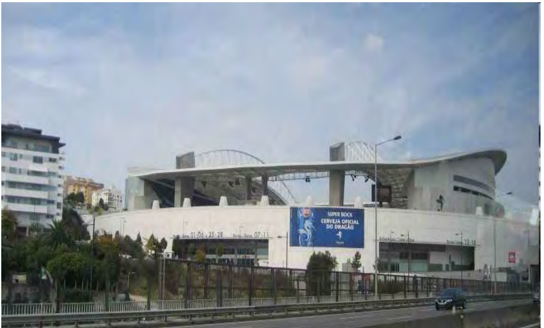
Foci stadion Porto-ban.